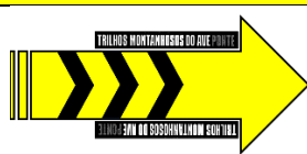
Seta de orientação/direção